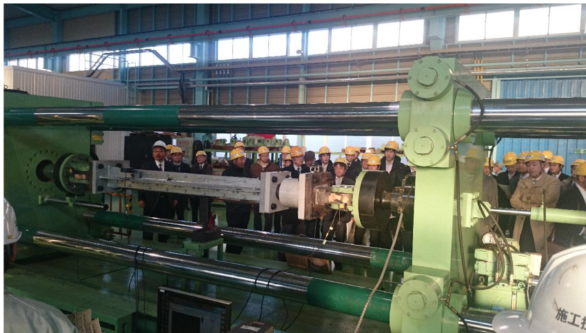
座屈拘束型ダンパー動的性能試験の公開実験見学の様子